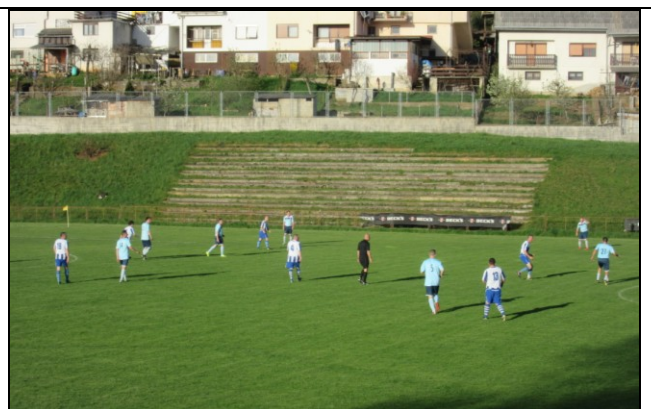
Slike s utakmice Duga Resa - Slunj