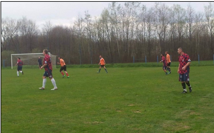
Slike s utakmice Zrinski Ozalj - Vojnić 95